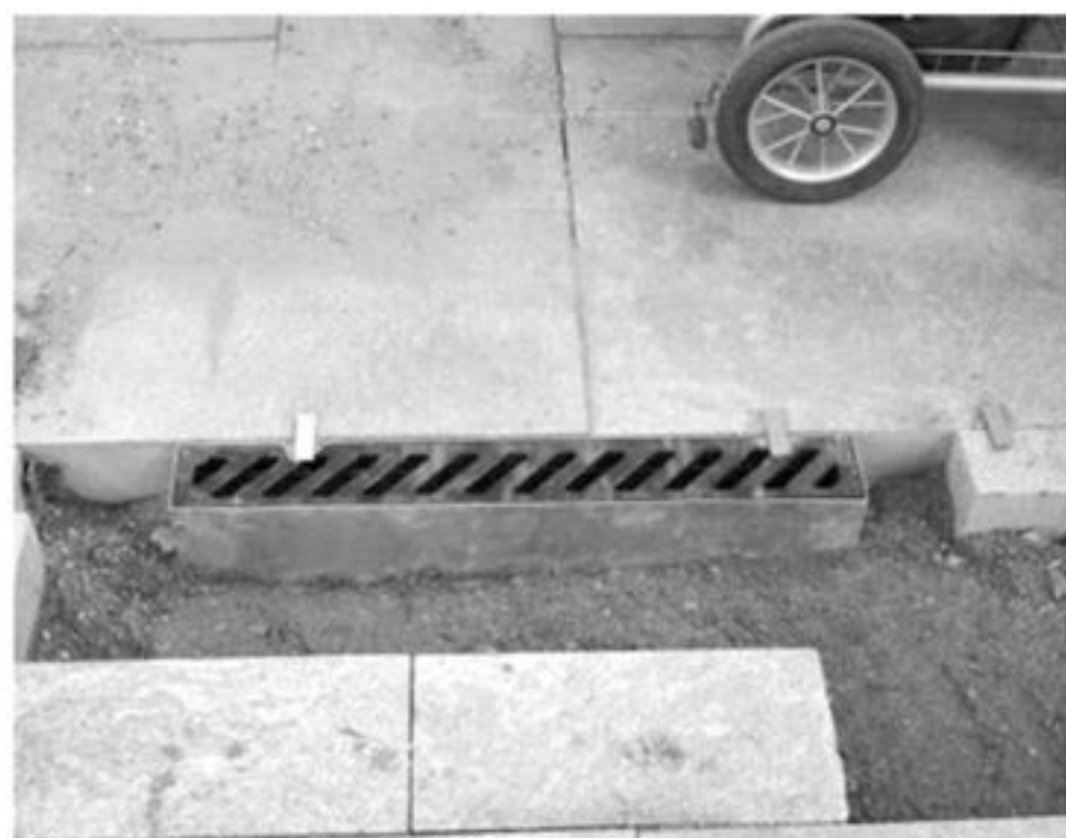
Udløbskassen sættes som en kantsten