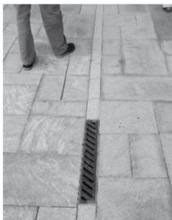
I en granitbelægning