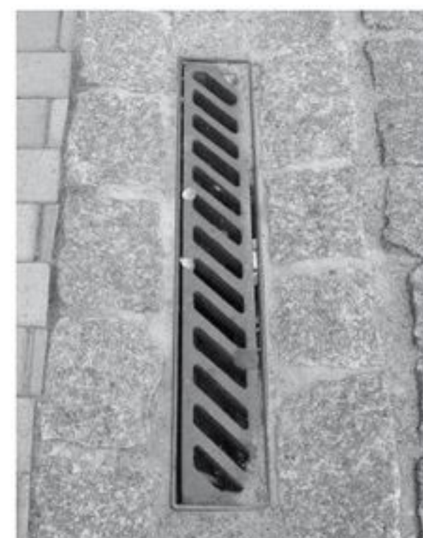
I et Chausséstensbånd