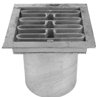
40 tons rist