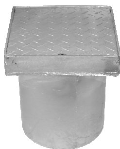
2,5 tons dæksel