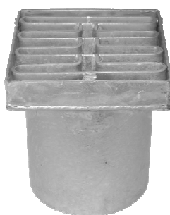
25 tons rist