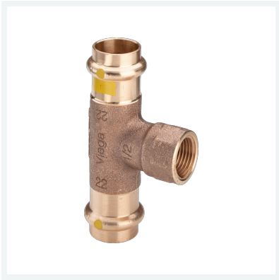
Profipress G T-stykke med SC-Contur model 2617.2 art.nr. 352 776