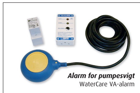
Alarm for pumpevig WaterCare VA-alarm

*) Bestående af 2 stk. Watercare septiktanke.