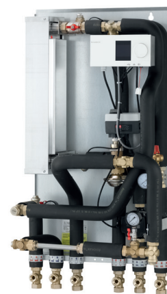
VX Solo 22 med ECL 310 - automatik 1 kreds

En hensigtsmæssig rørføring og konsekvent samling med omløbere gør det nemt at servicere og montere unitten. Montage er hurtig og enkel. Unitten fastgøres på væg og da alle rør er placeret i rørbærafstand fra væg, er det muligt at etablere en pæn rørføring.